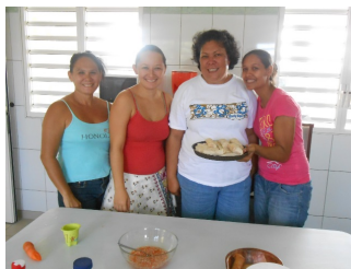
Atelier parents : confection de nems

L'atelier du mois de février consistait en la confection de nems pour fêter le nouvel an chinois. 6 parents y ont participé.