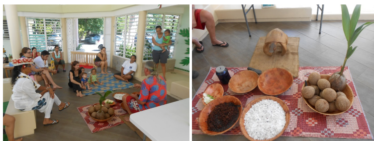
Démonstration de fabrication de monoï

Un intervenant extérieur est venu faire une démonstration de confection de monoï aux familles.