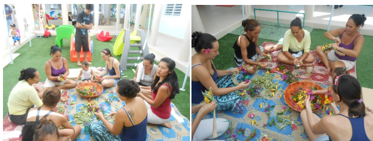
Confection d'un poara pour les mamans

En mars, l'atelier parents était un atelier de confection de « poaras ». Il a eu du succès auprès de 7 mamans.