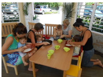
Réalisation de ipo traditionnel