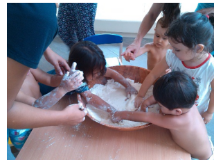
Atelier galette des rois