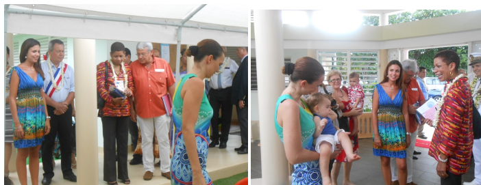
Visite de la Ministre