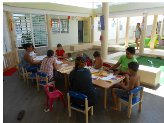
Réalisation de lanternes