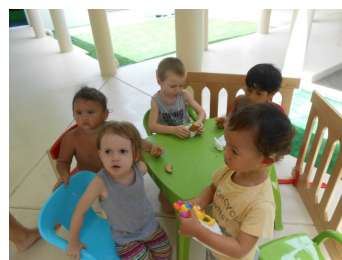
Nouvel An Chinois

L'atelier parents est un lieu d'échange de savoir-faire dirigé par des parents eux-mêmes ou sur invitation d'un intervenant extérieur dans l'objectif de transmissions trans générationnelles.